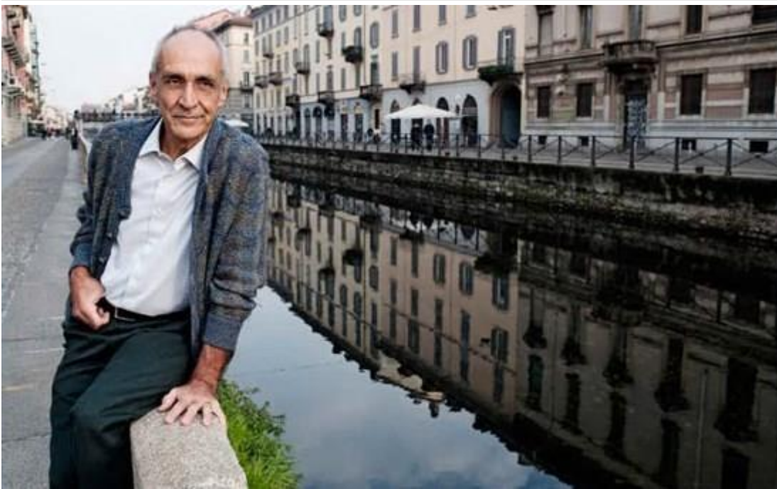
Pietro Ichino a Milano, sui Navigli

Avvocato, grande esperto di diritto del lavoro, sindacalista e parlamentare: Pietro Ichino nella sua lunga carriera pubblica è stato tutto questo e anche molto di più, dato che il suo nome è intrinsecamente legato alle riforme del mercato del lavoro avviate in Italia negli ultimi anni. Riforme per le quali Ichino è stato al centro di molte polemiche e per le quali ha pagato anche un prezzo personale con accuse e anni passati sotto scorta dopo che due altri giuslavoristi come lui, Massimo D'Antona e Marco Biagi, erano già caduti vittima degli ultimi rigurgiti del terrorismo rosso. Nonostante questo, Pietro Ichino non è mai venuto meno al suo impegno verso i problemi del lavoro, un impegno che ha accompagnato tutta la sua vicenda umana e professionale. Una vicenda umana e professionale che il giuslavorista milanese ripercorre nel suo ultimo libro, La casa nella pineta (Giunti, 2018, Euro 18,00, pp. 480. Anche Ebook), grande affresco di vita familiare perennemente a cavallo tra pubblico e privato. Sì, perché Pietro Ichino ci apre le porte dei suoi ricordi personali, racconta la storia della sua famiglia – una famiglia borghese del Novecento come recita il sottotitolo – e allo stesso tempo ritrova la storia italiana del secolo scorso.