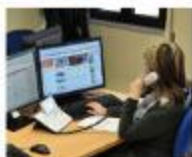
Dele dignem qu laoreet praesent luptatum zzril delenit augue duis dolore te feugiat nulla facilisis at vero eros et accumsan et justo odio dignissim qui blandit praesent luptatum zzril delenit augue duis dolore te feugiat nulla facilisis.