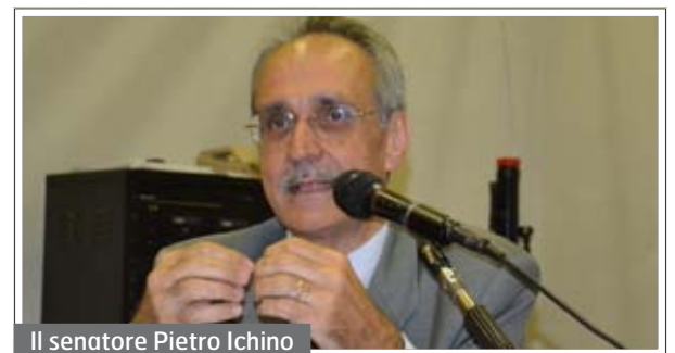
Il senatore Pietro Ichino

“Il primo impatto sarà quello di una facilità molto maggiore di lettura della normativa: chiunque, anche senza l'assistenza di un esperto, potrà cercare e trovare facilmente nel nuovo Codice la norma che regola ogni aspetto del contratto di lavoro. Resta fuori, per ora la materia pro-