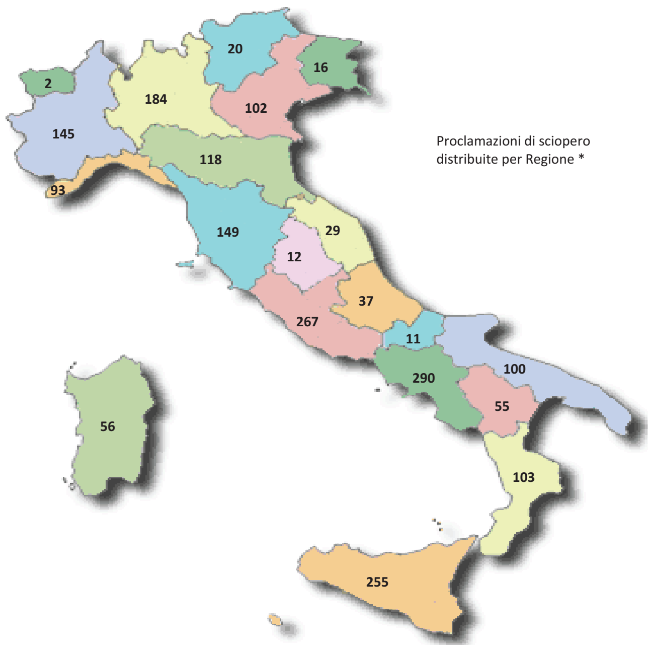
Tabella 5 - Grafico 2